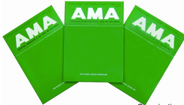
Organizations with reading populations: